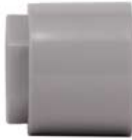
③バルブ取り付け用ジョイント