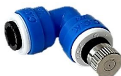
L型継手+ノズル (0.3mm) × 1個