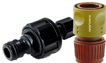
ホースアダプター