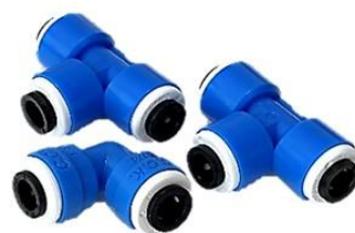
T型継手 (2個) L型継手 (1個)