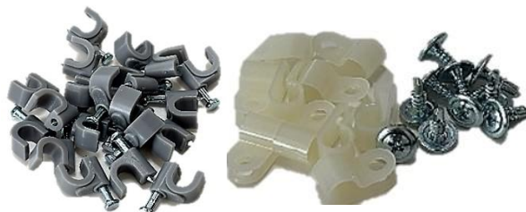
チューブ固定資材