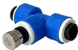
T型継手+ノズル (0.3mm) × 7個